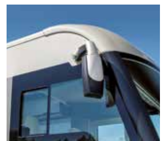
Isolatieuiten in de bestuurderscabine