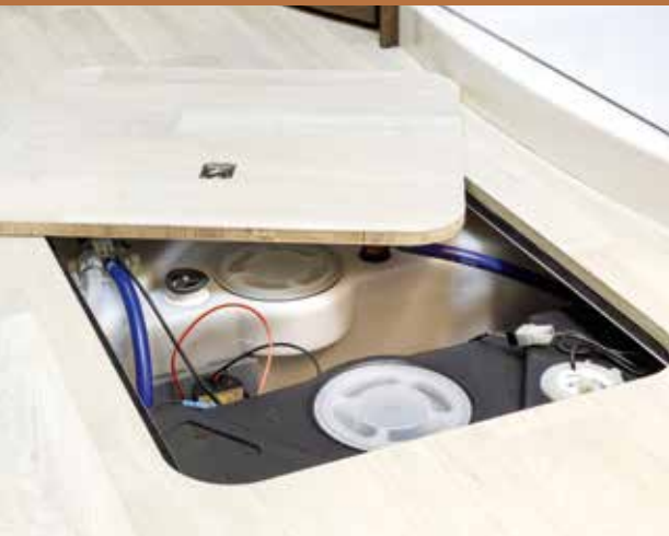
Doorlopende traploze FRANKIA dubbele bodem van binnenuit en buitenaf toegankelijk