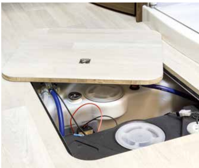
Doorlopende verwarmde dubbele FRANKIA bodem