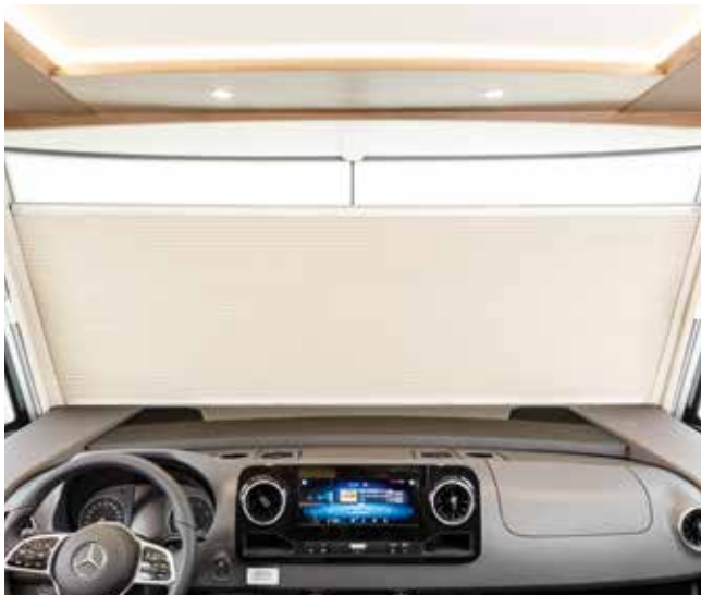
Elektrisch verduisteringsplissé aan de voorzijde