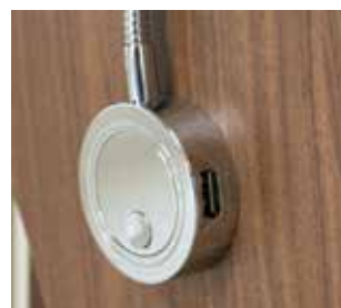
Diverse praktische USB-contactdozen