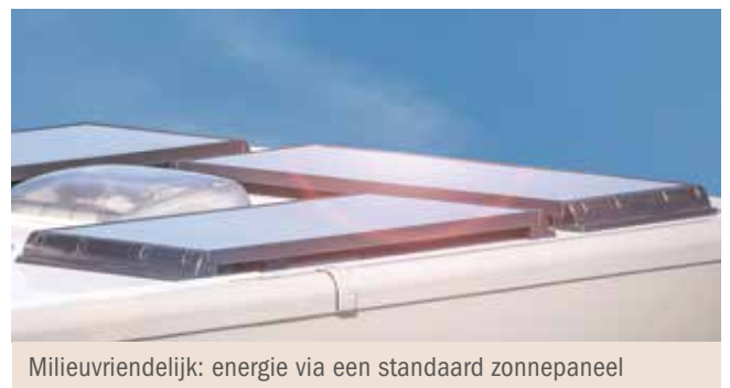
Milieuvriendelijk: energie via een standaard zonnepaneel