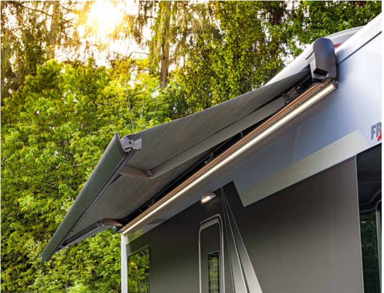
Luifel – optioneel met geïntegreerd LED-verlichtingsprofiel (afbeelding als voorbeeld)