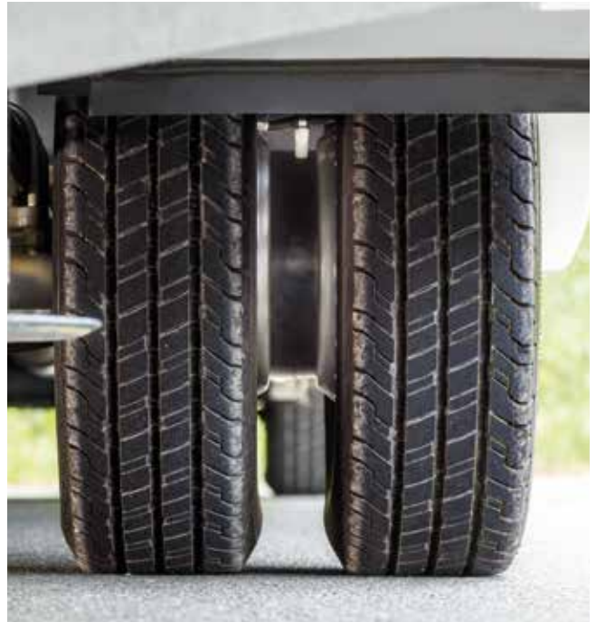
Spoorverbreding (afbeelding als voorbeeld)

Handmatig bedienbare Thule-luifel, 5,5 m, antracietkleurige luifelbehuizing (FINAL SIX: elektrische Thule-luifel 5,5 m, luifelbehuizing in antraciet)