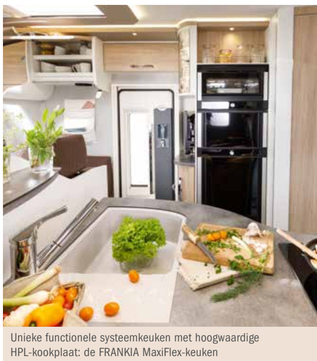
Unieke functionele systeemkeuken met hoogwaardige HPL-kookplaat: de FRANKIA MaxiFlex-keuken