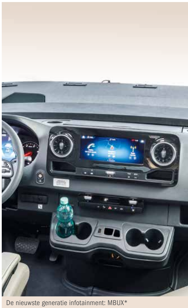
De nieuwste generatie infotainment: MBUX*