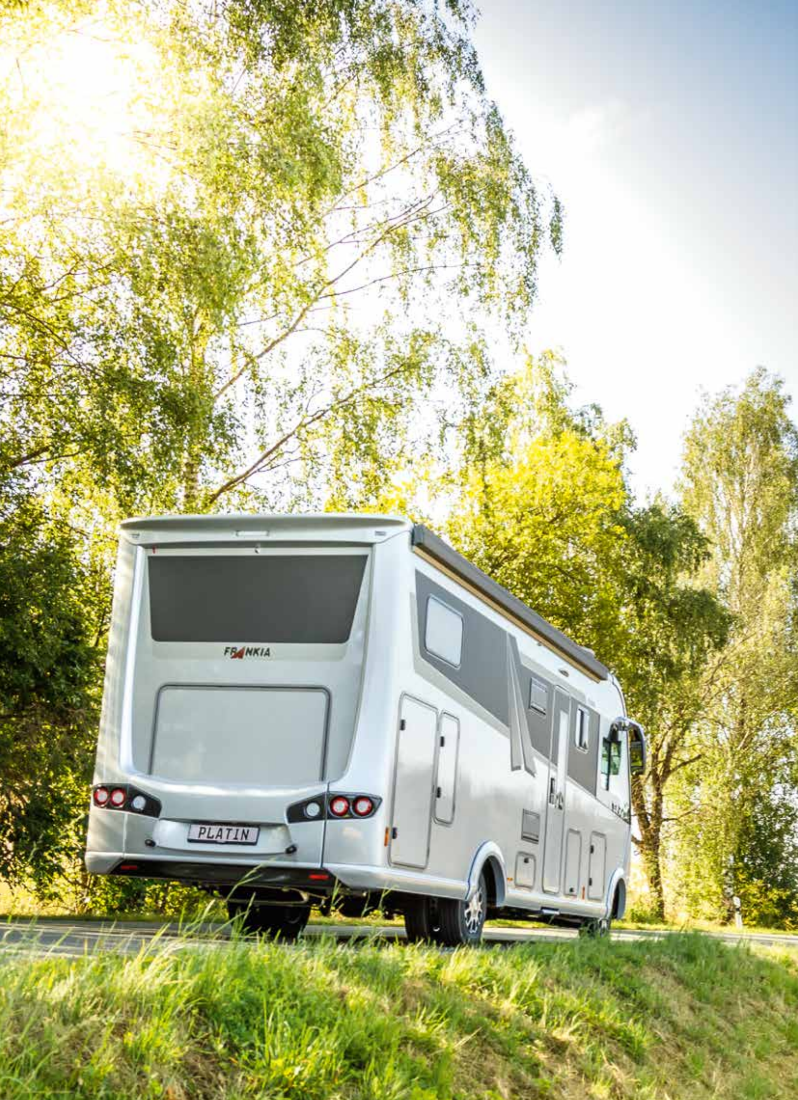
2 FRANKIA I 7900 GD PLATIN in de kleurvariant silver-arrow (afbeelding als voorbeeld)