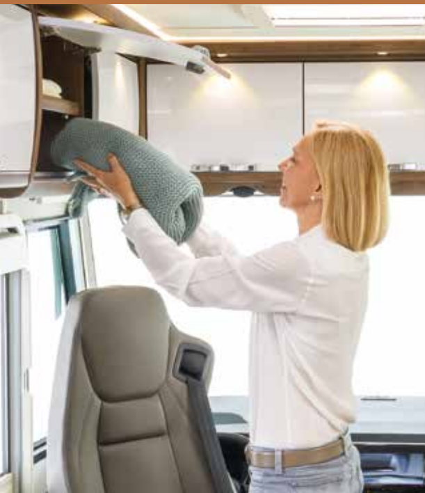
Heel veel opbergmogelijkheden in het interieur - altijd gemakkelijk bereikbaar