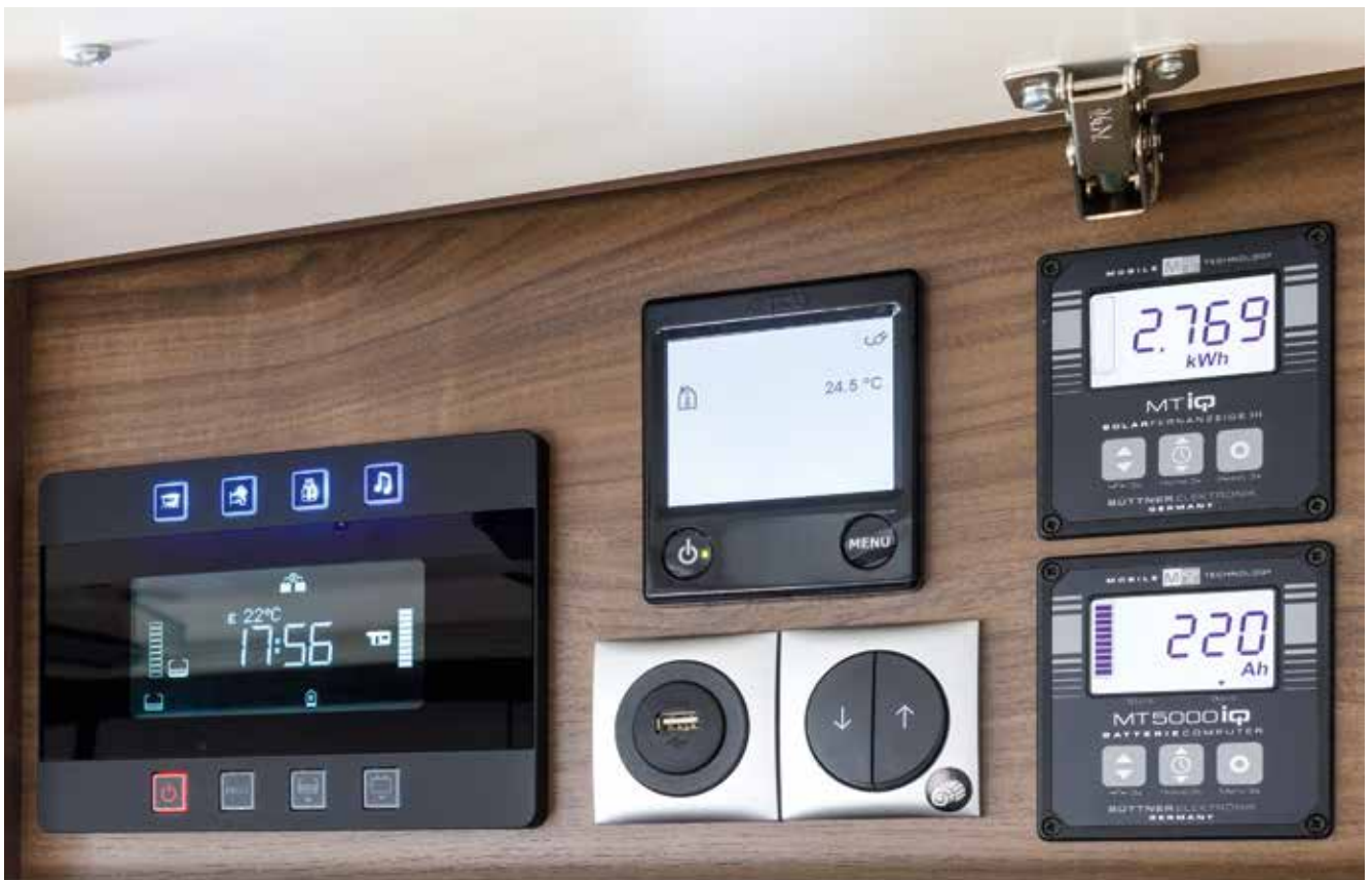
Centrale besturing: goed zichtbaar en eenvoudig te bedienen